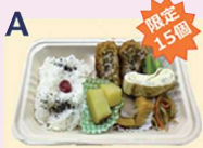
メンチカツ弁当(白米)