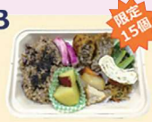
メンチカツ弁当(玄米)