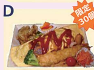
つるじい卵のオムライス