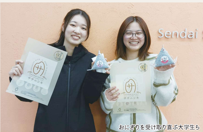
おにぎりを受け取り喜ぶ大学生ら

JAグループ宮城は勉学に励む学生に生産者の様々な思いを込めた宮城県産米(環境保全米も使用)のおにぎりを提供することで、食や環境への関心を広げ、さらには朝食の大切さについて考えるきっかけにしてほしいと、授業前の朝の時間帯に大学でおにぎりを配布しています。