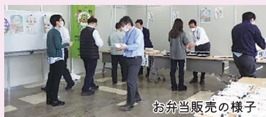
お弁当販売の様子

※有機農業推進法の成立・施行から10周年を記念し、2016年に一般社団法人次代の農と食をつくる会により12月8日が「有機農業の日」として制定されました。