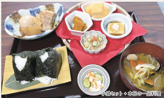
小鉢セット+本日の一品料理