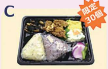
国産鶏のおいしい唐揚げ弁当