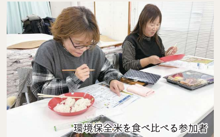
環境保全米を食べ比べる参加者

今後は農薬と化学肥料を一切使わない有機栽培の面積を増やしていきたい。私たちの農業を学びに来る生産者も多く、技術提供もしていきたい。若手農業者が巣立つ町を目指したい。同時に消費者とのつながりを深め、「あの人のお米が欲しい」と印象づける事業展開を目指していきます。