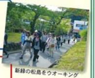
新緑の松島をウォーキング

「百歳元気にここに体操」とウォーキングをJAの仲間と楽しみながら行い、足腰の健康を保ちます！