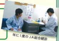
年に1度のJA総合健診

JA総合健診「人間ドック」やミニドックを受診して、自らの健康状態を確認し、生活習慣の改善を図ります！